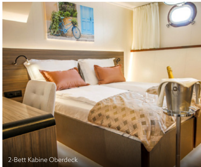
2-Bett Kabine Oberdeck

15 Tage | Trogir • Dubrovnik • Zadar • Trogir 234