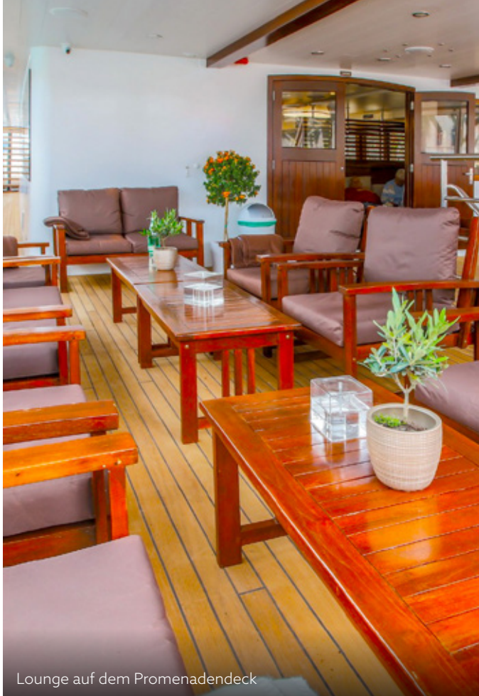
Lounge auf dem Promenadendeck